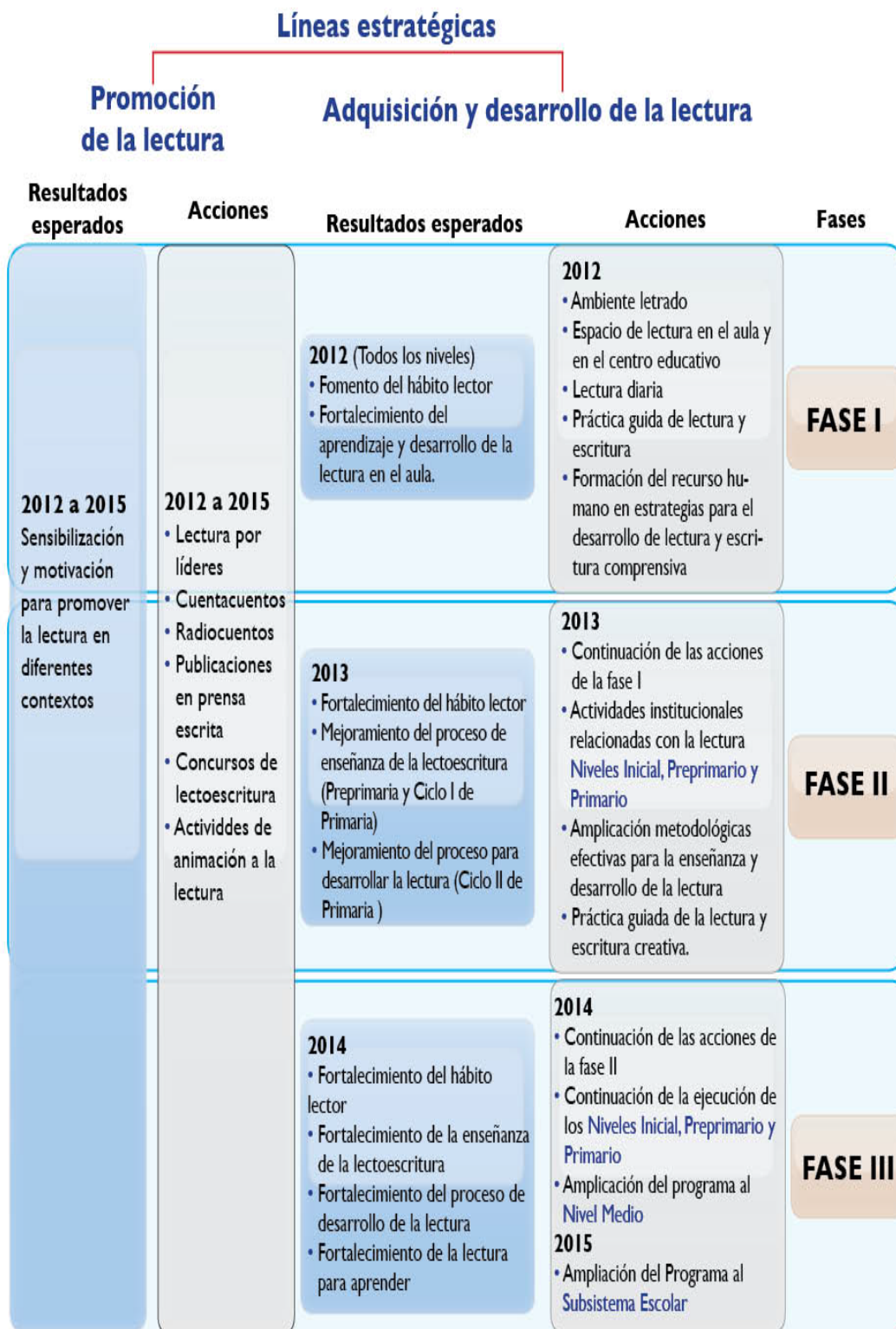
Esquema 3. Resultados esperados y acciones de cada fase de implementación