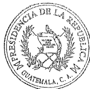
ALVARO COLOM CABALLEROS