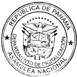
ISABEL DE SAINT MALO DE ALVARADO Ministra de Relaciones Exteriores