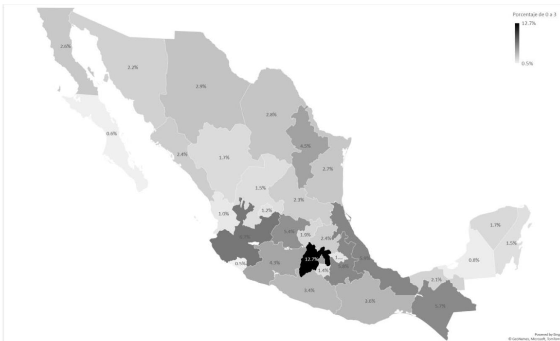
Mapa 1. Distribución del porcentaje total de niñas y niños de cero a tres años en el país