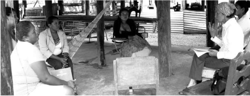
Facilitadoras de Llano Verde, Tuapi, Puerto Cabezas, explican equipo de Sistematización, sus experiencias en la CNA.