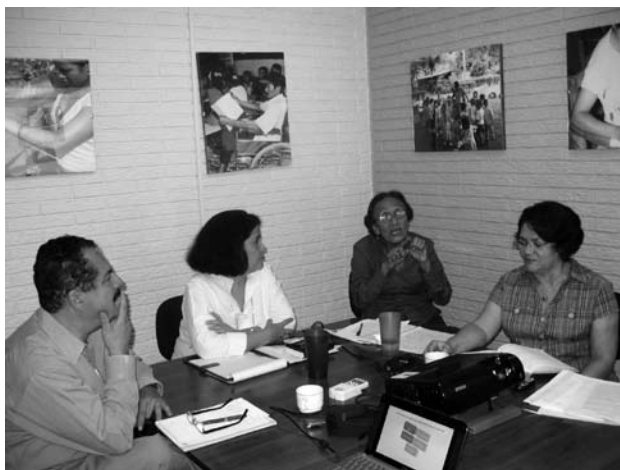
Equipo de Sistematización

Sin embargo, la experiencia aporta importantes estrategias para la sostenibilidad de los aprendizajes y el continuo educativo de neolectores/as.