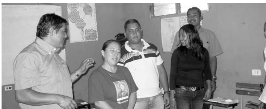
Técnicos de ALFA / EDA explican situación de la CNA en los municipios de Boaco. Taller de Sistematización de Boaco.

Esta frase emanada de los Boaqueños, a propósito de identificar los momentos relevantes de la experiencia cobra su vigencia y validez en el proceso de reconstrucción de la experiencia al identificar que