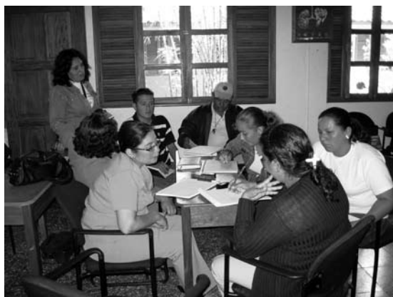
Técnicos ALFA / EDA del MINED en trabajo de grupo. Taller de Sistematización en Jinotega.

Desde los talleres de sistematización los equipos produjeron expresiones alusivas a la Campaña de Alfabetización “De Martí a Fidel” popularizando esas expectativas y esperanzas en frases, pensamientos, versos, coplas y canciones alusivas a sus compromisos y a sus identidades con lo educativo.