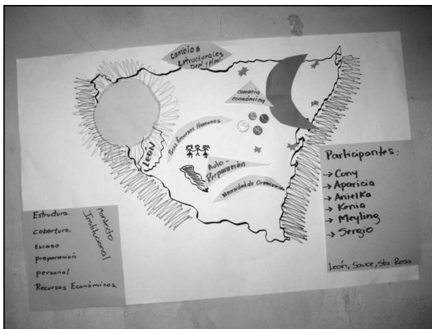
Contexto Institucional graficado por los técnicos ALFA / EDA en el Taller de Sistematización realizado en León.

En el proceso del ejercicio grupal, identificamos que la CNA, como una gran acción social, se vió influenciada por cambios de orientaciones, decretos presidenciales y ministeriales, limitaciones financieras y burocracia administrativa, entre otros factores, siendo estos últimos expresión de momentos críticos ante el reiterado problema de contratación de personal técnico con poca experiencia en educación y retraso en sus salarios y viáticos.