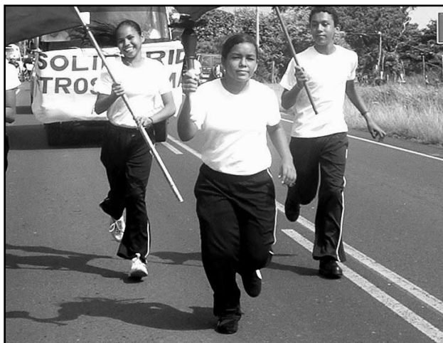
Jóvenes estudiantes de la FES, participan en acto de Declaratoria de Territorio Libre de Analfabetismo.

Estos aprendizajes también sirven de apoyo para reorientar el trabajo o para desarrollar nuevas intervenciones en situaciones similares. Cuando los aprendizajes se comparten, la sistematización facilita la contrastación entre los diversos trabajos y ayuda a no partir de cero o repetir errores, contribuyendo a mejorar la práctica de otros/as.