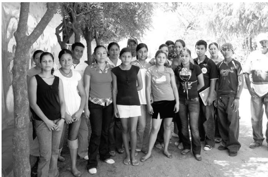
Brigada de Facilitadores de la J. S. 19 de Julio de Santa Rosa del Peñón.